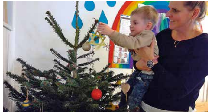
... wir schmücken unseren Weihnachtsbaum mit unseren selbstgebastelten Anhängern