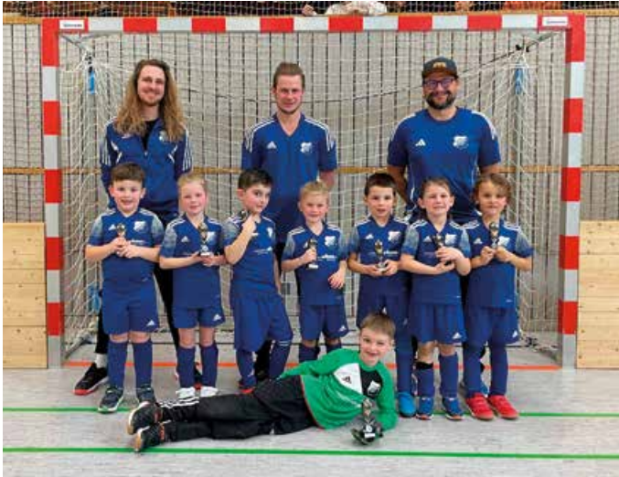
G-Jugend beim Turnier in Ebersbach