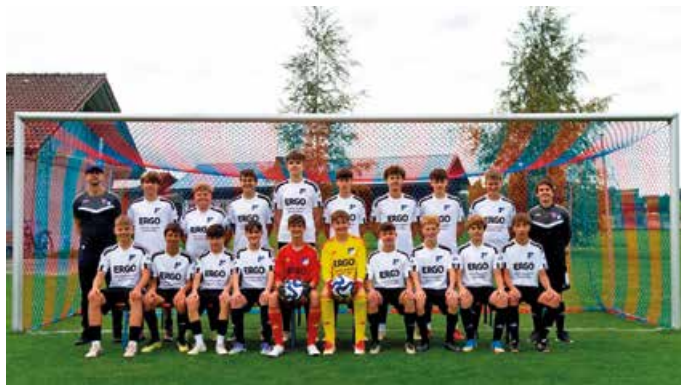
Ungeschlagen zum Aufstieg: Unsere B-Jugend

Die B-Jugend der SG Thingau-Görisried krönt eine herausragende Hinrunde ohne eine einzige Niederlage mit dem Aufstieg in die Kreisliga – ein echtes Novum in unserer jüngeren Vereinsgeschichte. Am letzten Spieltag verpasste das Team mit einem 2:2-Unentschieden zwar knapp die Meisterschaft, der zweite Platz reichte jedoch für den verdienten Aufstieg.