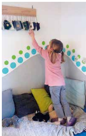
... wir öffnen unseren selbstgebastelten Adventskalender