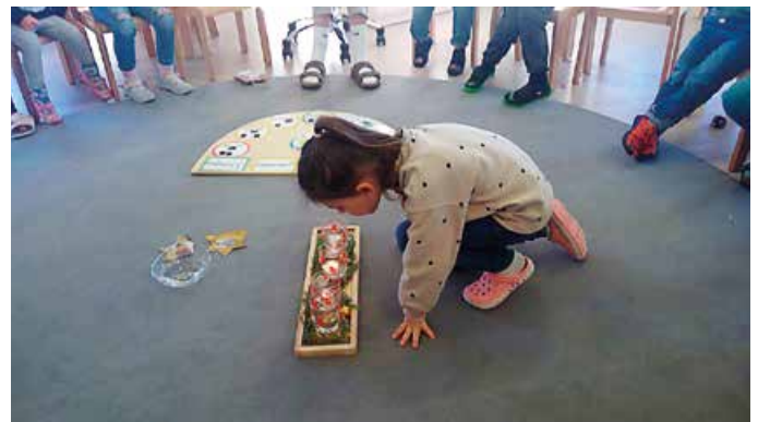
... wir zünden die Kerzen am Adventskranz an