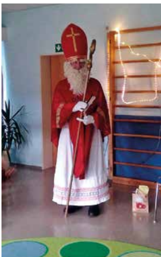
... der Nikolaus besucht uns