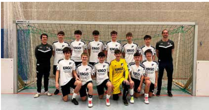
B-Jugend wird Zweiter in Wald

Auch unsere B-Jugend war in der Halle erfolgreich unterwegs! Ende Januar nahm die U17 bei der 20. Ausgabe der Waldhalla-Hallenturniere teil und durfte sich nach spannenden Begegnungen über einen zweiten Platz freuen. Herzlichen Glückwunsch!